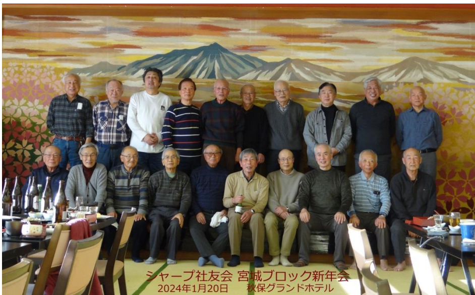
シャープ社友会 宮城ブロック新年会 2024年1月20日 秋保グランドホテル